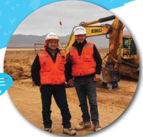
EQUIPO PREVENCIÓN DE RIESGOS CARBONATO DE LITIO