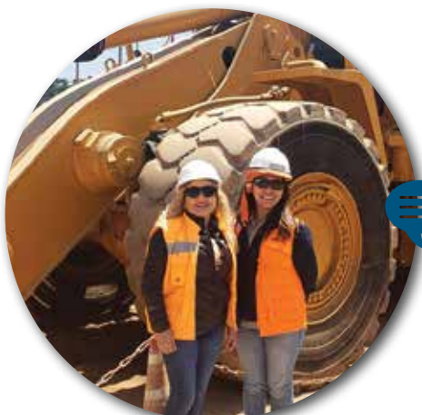
PREVENCIÓN DE RIESGOS SITIO LA NEGRA