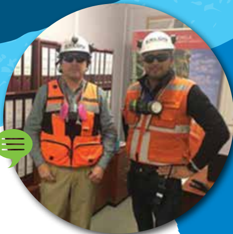
EQUIPO PREVENCIÓN DE RIESGOS CENTINELA

NUESTROS PREVENCIÓNISTAS DE RIESGO SON ALIADOS CERCANOS DE LOS DISTINTOS EQUIPOS DE TRABAJO EN LAS DIFERENTES OBRAS. ESTÁN AHÍ PORQUE EXCON NO TRANSA EN ESTE TEMA Y ESTÁ CONVENCIDO DE QUE LA SEGURIDAD ES SU VALOR MÁS IMPORTANTE.