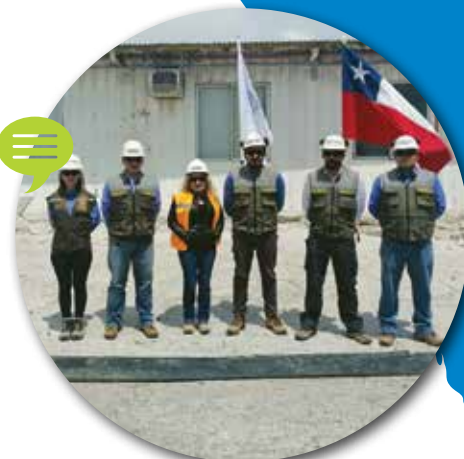
EQUIPO PREVENCIÓN DE RIESGOS TOCONAO