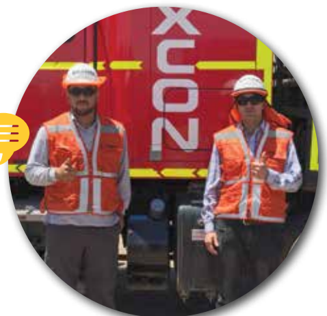
EQUIPO PREVENCIÓN DE RIESGOS SITIO POZO ALMONTE