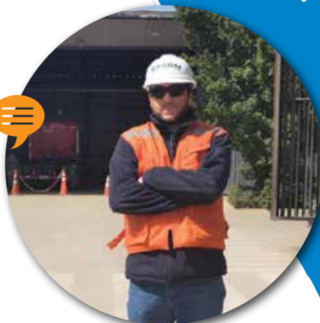
PREVENCIÓN DE RIESGOS SITIO LO PINTO