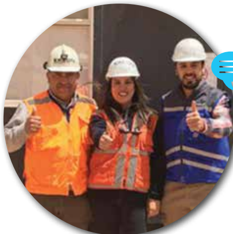
EQUIPO PREVENCIÓN DE RIESGOS QUEBRADA BLANCA 2