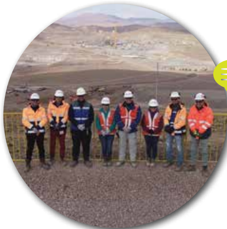
EQUIPO PREVENCIÓN DE RIESGOS QUEBRADA BLANCA 1